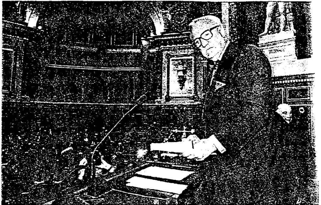
Christian Poncelet: «Le Sénat doit résister à la tentation de toujours oui ou toujours non».

Après avoir devancé René Monory au premier tour, puis Daniel Hoeffel au second, le RPR Christian Poncelet a été élu président du Sénat à "troisième tour de scrutin. Il a recueilli 189 voix sur les 320 sénateurs votants. (Louis Le Pensec , toujours ministre de l'Agriculture, ne participait Pas au vote).